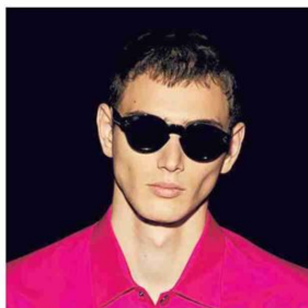
▲ Grinta Gli occhiali District People