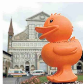
▲ Il negozio Apre Save The Duck