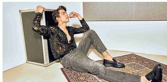
▲ Underground Il mocassino CULT modello Ozzy, total black